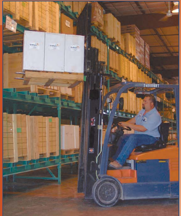
Las modernas facilidades de almacén de EnDyn mantienen un inventario multimillonario en dólares y operan 24 horas al día, 7 días a la semana.