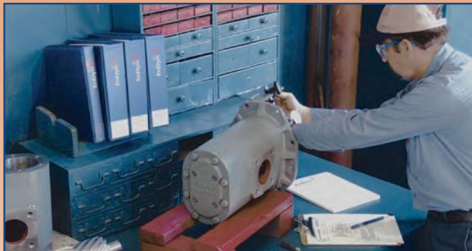
EnDyn ofrece un programa completo de intercambio de componentes mayores y ensamblajes.

Adicional a los repuestos nuevos PowerParts® para reemplazo, EnDyn provee partes y ensamblajes reacondicionados para motores y compresores Superior® . Esto incluye paquetes completos de compresión adaptados a sus necesidades. EnDyn remanufactura estas partes, ensamblajes y conjuntos con las mismas especificaciones "como nuevo", con (1) año de garantía.