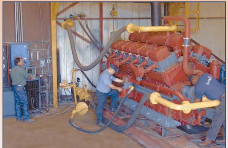
Pruebas de motores a plena carga, efectuadas por nuestros Técnicos Especialistas, aseguran un trabajo de calidad de cada mantenimiento mayor realizado en nuestros talleres.