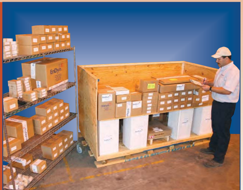
No compre más de lo que necesita – los Juegos de PowerParts® "J.I.T." son personalizados, empacados y despachados en una sola caja